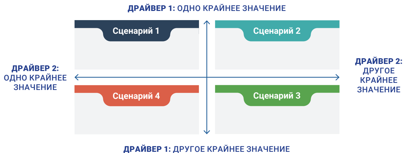
Рис. 2. Пример сценарной матрицы

Этот метод помогает составить до четырех сценариев, относящихся к конкретной области, размещая два фактора (также называемые неопределенностями/движущими силами/драйверами), влияющими на будущее изучаемой проблемы, по двум осям. Они пересекаются, образуя четыре квадранта. Чтобы сделать правильный выбор неопределенностей, участники семинара анализируют и ранжируют результаты своего упражнения STEEP анализа, т. е. тренды и назревающие сигналы, которые можно в совокупности назвать движущими силами. Некоторые силы, например, демография, относительно детерминированы или предсказуемы. Другие, например, общественное мнение, крайне неопределенны. Участники семинара обсуждают, насколько важен каждый тренд/назревающий сигнал для рассматриваемой темы. Когда идентифицировано более двух неопределенностей, матрица 2x2 требует объединения (кластеризации) двух или более неопределенностей в более сложный график (Рис. 2).