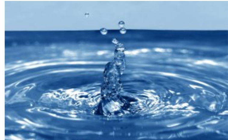
Использование природных ресурсов