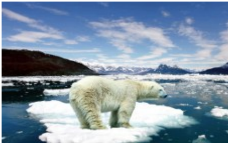
Вклад в изменение климата