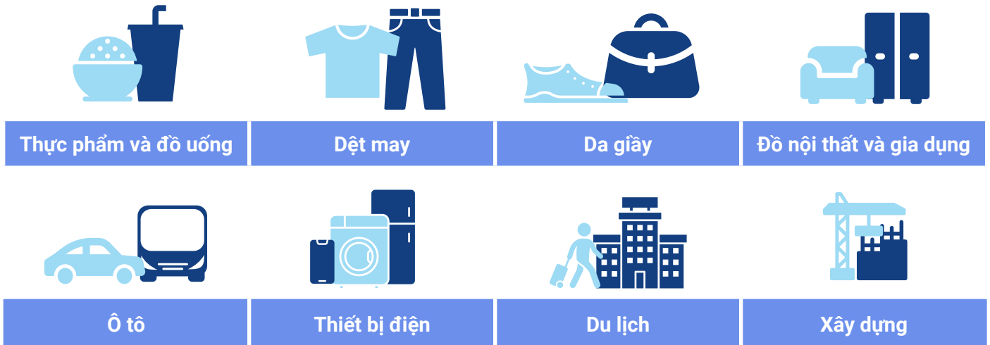
Hình 2: Các lĩnh vực ưu tiên về kinh tế tuần hoàn cho các nước ASEAN

Mặc dù về nguyên tắc, kinh tế tuần hoàn có thể áp dụng trong tất cả các lĩnh vực, nhưng có thể ưu tiên cho một số lĩnh vực có vai trò quan trọng trong nền kinh tế và thương mại, sử dụng nhiều tài nguyên và có nhiều tiềm năng đổi mới tuần hoàn. Do đó, tám lĩnh vực ưu tiên được đề xuất cho hành động của doanh nghiệp về kinh tế tuần hoàn ở ASEAN. Mỗi quốc gia dựa trên điều kiện của mình cũng như các thế mạnh, cơ hội kinh doanh và đổi mới nên ưu tiên hơn nữa và thu hẹp các lĩnh vực ưu tiên.